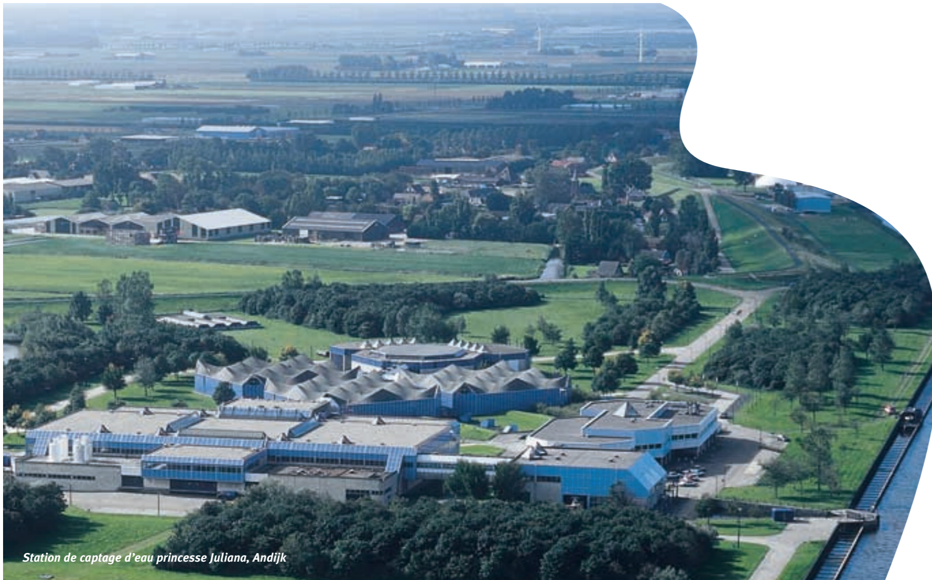
Station de captage d'eau princesse Juliana, Andijk

Nos eaux de surface sont notre eau potable